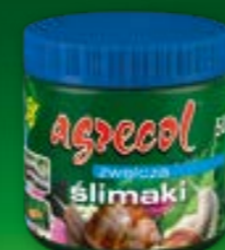
Ślimax GB - preparat na ślimaki

Inne przydatne w uprawach produkty AGRECOL