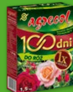
100 DNI DO RÓŻ - nawóz długo działający

Ze środków ochrony roślin należy korzystać z zachowaniem bezpieczeństwa. Przed każdym użyciem przeczytaj informacje zamieszczone w etykiecie i informacje dotyczące produktu. Zapoznaj się z zagrożeniami i postępuj zgodnie ze środkami ostrożności wymienionymi na etykiecie.