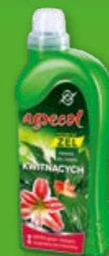
MINERAL ŻEL - nawóz do roślin kwitnących